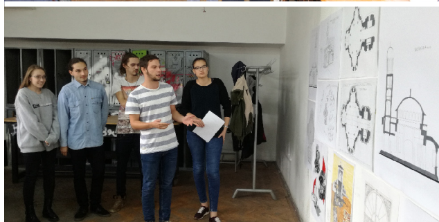
28. 10. 2016 - vernisajul expoziției, la Episcopia Giurgiului.