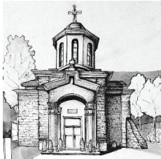
D. Biserica "Sf. Nicolae" 1830 GR-II-m-B-14890 str. Mircea cel Bătrân, nr. 38, Giurgiu.