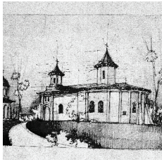
B. Biserica "Sf. Treime" Smârda 1852 GR-II-m-B-14863 str. Braniștei, nr. 3, Giurgiu.