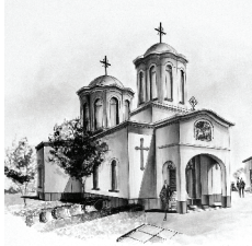
E. Biserica "Sf. Gheorghe" 1840, ref. 1937, 2004 GR-II-m-B-14861 str. Tudor Vianu, nr. 1, Giurgiu.