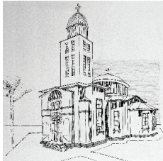
C. Biserica "Înălțarea Domnului" - a Eroilor 1939 GR-II-m-B-14867.01 bd. București, nr. 18A, Giurgiu.