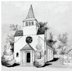
A. Biserica romano-catolică 1885 GR-II-m-B-14861 str. Hristo Botev, nr. 12, Giurgiu.